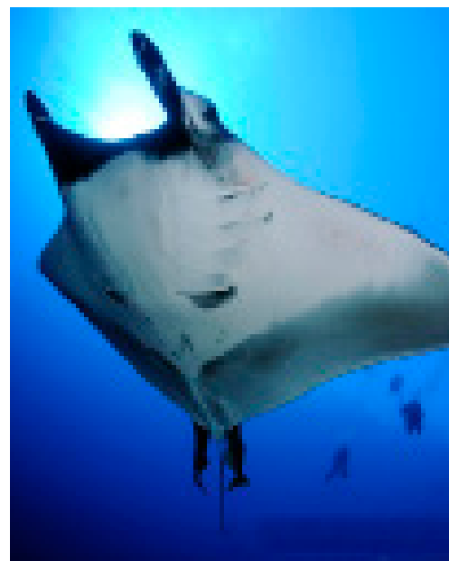
Raie manta