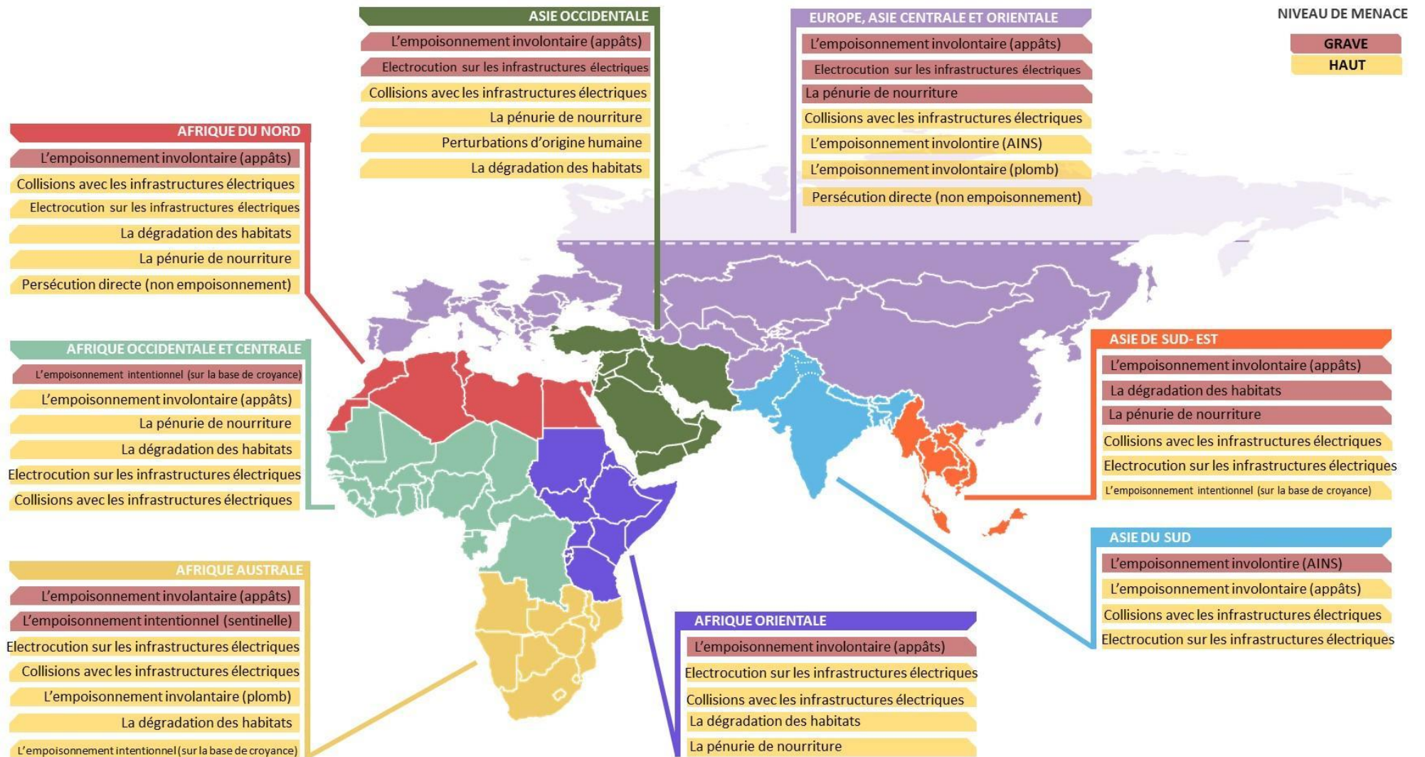
Carte indiquant les menaces les plus urgentes pour les aires de répartition du MsAP Vautours. La Fédération de Russie est un État de l'aire de répartition, mais les vautours sont restreints aux régions du Caucase du Nord et de Altaï-Sayan (ce dernier étant près des frontières de la Mongolie et du Kazakhstan) ; plus généralement des parties de la Fédération ne sont pas affichées